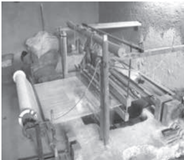
شکل ۱- دستگاه گلیم بافی سنتی مورد استفاده جهت بافت پارچه

برای ساخت کامپوزیت مورد آزمون، از چیدمان چندلایه الیاف تک جهت و همچنین بافت پارچه‌ای استفاده شد و نمونه‌ها به صورت ترکیبی از الیاف کنف-پلی استر و کنف-شیشه ساخته شدند. برای بافت پارچه جنس نخ تار از کنف و نخ پود از پلی استر/شیشه بود و از دستگاه گلیم بافی سنتی با ماکو استفاده شد که دستگاه مورد نظر در شکل ۱ نشان داده شده است. نمونه پارچه بافته شده در شکل ۲ نمایش داده شده است.