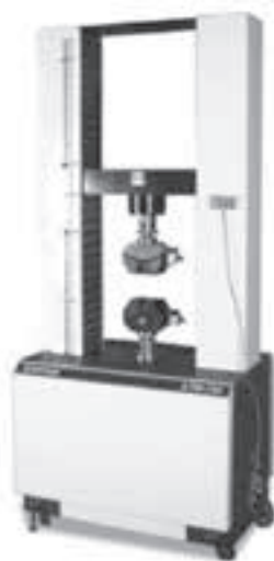
شکل ۴- نمای کلی دستگاه اعمال بار برای انجام تست‌های کشش و خمش